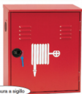
Chiusura a sigillo

CASSETTE PER IDRANTI A MURO SERIE TEXAS® MODELLO S. LE CASSETTE UNI 45 SONO COSTRUITE SECONDO LA NORMA UNI EN 671-2