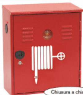
Chiusura a chiave

CASSETTE PER IDRANTI A MURO SERIE TEXAS® MODELLO C. LE CASSETTE UNI 45 SONO COSTRUITE SECONDO LA NORMA UNI EN 671-2